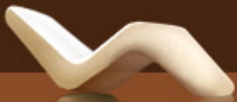
Table Table Charente rec